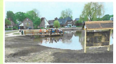
Insectenhotel voor vijver Zenderen